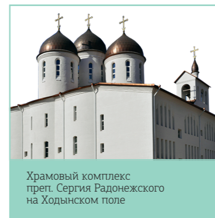
Храмовый комплекс прп. Сергия Радонежского на Ходынском поле