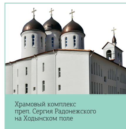
Храмовый комплекс прп. Сергия Радонежского на Ходынском поле