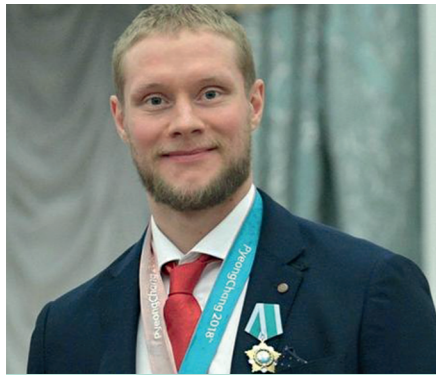
СЕРГЕЙ АНДРОНОВ российский хоккеист, центральный нападающий клуба КХЛ ЦСКА, Заслуженный мастер спорта России., олимпийский чемпион 2018 года

Сергей, вы носите имя преп. Сергия... Можете вспомнить, когда и как вы познакомились с личностью преп. Сергия Радонежского?